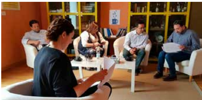
Café Europa con representantes políticos

Se trata de una actividad de debate local sobre el futuro de Europa en la que hemos participado tres CIED andaluces (Andalucía Rural, Andújar y Campo de Gibraltar). Nosotros hemos realizado tres sesiones de más de dos horas de duración cada una que han reunido a representantes políticos, asociaciones y jóvenes, respectivamente. A partir de los debates y para difundir sus resultados, nuestro centro ha realizado tres vídeos que se han dado a conocer por redes sociales.