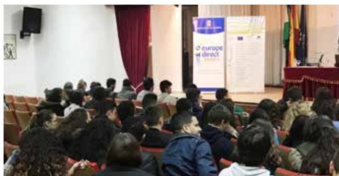
Taller sobre Movilidad Europea