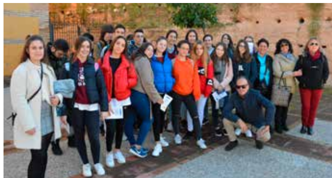
IES Nuestra Señora de la Cabeza visitando la Muralla almohade

Se hizo hincapié en que este año se celebra el Año Europeo del Patrimonio, y se habló de todas las acciones que realiza la UE para salvaguardar y fomentar el cuidado del patrimonio europeo.