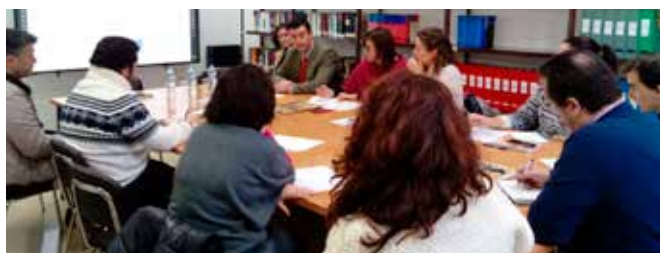
Intercambio de opiniones entre beneficiarios de Fondos Europeos

El objetivo era el de formar y asesorar a los beneficiarios de Fondos Europeos en el cumplimiento de sus obligaciones de información y comunicación, y de identificación y presentación de Buenas Prácticas, dirigida al personal que desarrolla actuaciones financiadas con Fondos Europeos gestionadas por alguna Consejería o ente instrumental de la Junta de Andalucía.