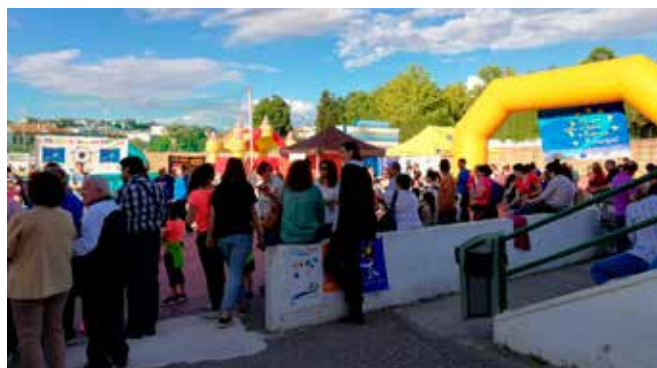
Fiesta Día de Europa

Durante la tarde del día 25 de mayo, desde las 17.00 hasta las 21.00 horas, se celebró, en las instalaciones deportivas municipales de Baena, una Fiesta Europea con juegos, regalos, talleres para niños, atracciones y competiciones deportivas. También montamos un punto de información, en el que además de distribuir información relacionada con la UE y con las Elecciones al Parlamento Europeo en 2019, se llevó a cabo una encuesta sobre la UE y su futuro.