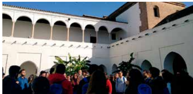
Erasmus y jóvenes de la provincia de Huelva

Esta actividad ha sido la contribución de la provincia de Huelva, a través del Centro de Información Europea "Europe Direct Huelva", a las celebraciones del Año europeo del Patrimonio Cultural 2018.