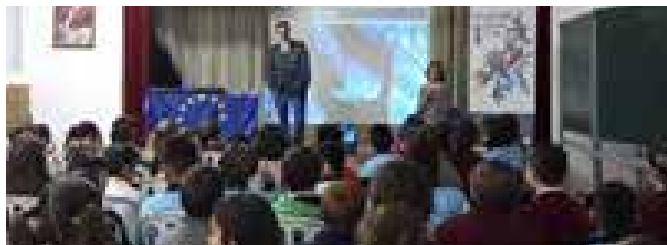
Taller infantil sobre la UE

Para su desarrollo se reunía en un aula a alumnos preferentemente de 5º y 6º de primaria con los que se trabajaba a través del relato, el baile y la música, los símbolos de la UE, sus valores, los países que la conforman, sus banderas y costumbres. 400 alumnos de primaria se han beneficiado de esta actividad.