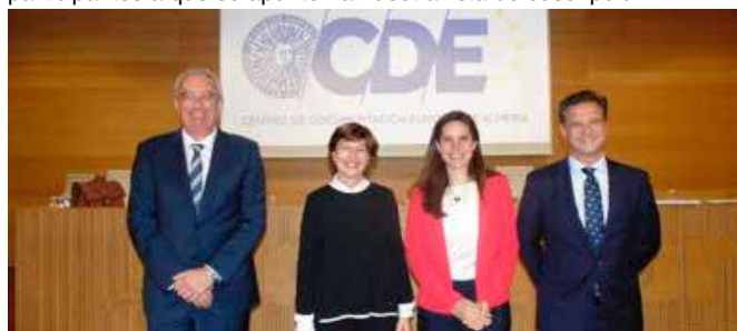
Jornadas "El Futuro de Europa"

de integración. Informar sobre los servicios del Centro y animar a los participantes a que se apunten a nuestra lista de suscripción.