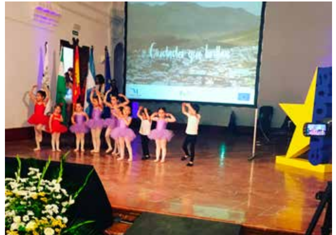
Día de Europa

Con la realización de este acto hemos dado a conocer y hemos reforzado el conocimiento de la UE y de las actuaciones que gracias a sus fondos se desarrollan en esas localidades y en su entorno. También hemos conseguido que los participantes al acto conozcan más sobre el patrimonio cultural de su municipio y de los municipios adyacentes.