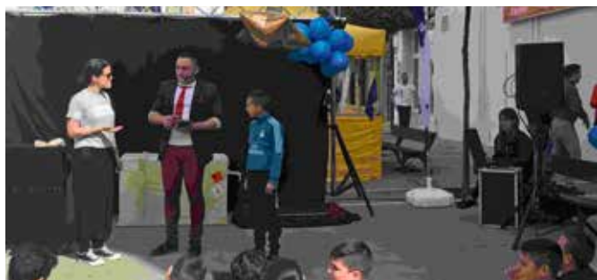
Punto de información en la Plaza Juan de Lima

Ubicación de Punto de Información y Consulta en Stand situado en la Plaza Juan de Lima, ubicada en un barrio alejado del centro, con el objetivo de acercar la UE a los ciudadanos más desfavorecidos. El stand llenó de color la plaza y los ciudadanos pudieron informarse sobre temas europeos y el futuro de Europa, el proceso del Brexit, futuras elecciones al Parlamento Europeo, Cuerpo Europeo de Solidaridad, etc.