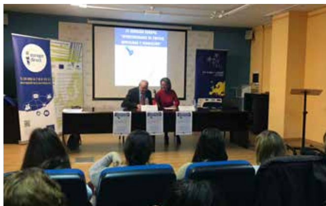
IV Jornada “Europa: Oportunidades de Empleo, Movilidad y Formación”

La jornada está destinada a jóvenes universitarios, desempleados y ciudadanos en general interesados en temas europeos.