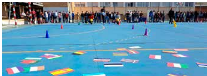
Gymkanas sobre la UE

Con esta actividad se ha fomentado el conocimiento de la Unión Europea entre los alumnos de enseñanza secundaria. A través de las pruebas a los que se sometían a los alumnos éstos han incrementado el conocimiento de la UE y los países que la conforman. 200 alumnos.