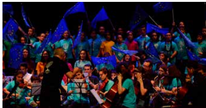
Actuación del Conservatorio de Música "Juan de Castro"