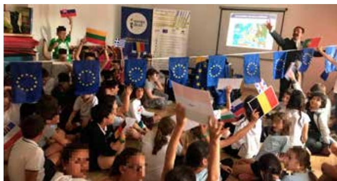
Día de Europa

El evento contó con el desarrollo de un flashmob sobre la bandera de Europa, y un espectáculo sobre magia relacionado con la UE. Entrega de material promocional relacionado con el evento a todos los asistentes, cuestionarios y recogida de consultas sobre la Unión Europea.