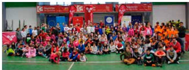
Hinojosa del Duque, 27 de octubre

En Cañete de las Torres, Hinojosa del Duque, Iznájar, La Victoria y Nueva Carteya. Con el fin de promocionar deportes menos conocidos entre los jóvenes de nuestra provincia, y celebrar una actividad lúdica con un carácter europeo en los municipios de la provincia. Apoyar la realización de eventos destinados a la ciudadanía. Participación de 565 jóvenes.