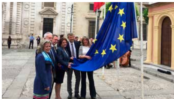
Acto de izada de la bandera de Europa

Para conmemorar este día se organizó el Seminario "La UE ante el reto de la Globalización" en el seno de la Universidad. Esta actividad se completó con una mesa informativa y la exposición de las banderas de la UE en la balconada de la Facultad de Derecho. Asimismo se realizó un acto institucional en el Rectorado donde las autoridades realizaron el acto de izada de la bandera acompañado de la banda municipal. En esta actividad se inscribieron 75 alumnos.