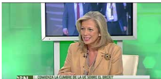
Intervención en Canal Sur de la Directora del CDE

Este año hemos estado presentes en la TV ya que colaboramos en Andalucía al Día de Canal Sur (en 9 ocasiones), en radio dado que desde febrero hacemos un programa mensual denominado Europeandus sobre la actualidad europea (en 11 programas) y en la prensa escrita (en 12 ocasiones).