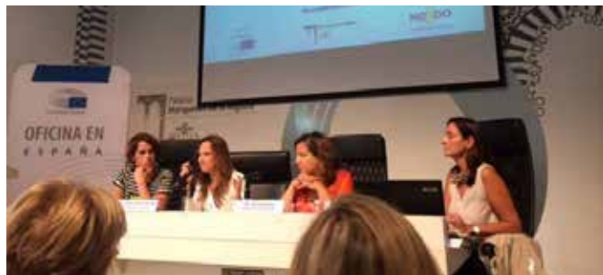
Seminario "Igualdad de Género"