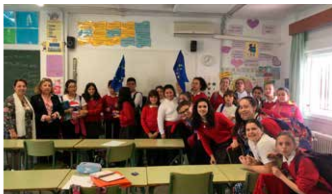
Talleres y charlas

Otro taller “Conoce lo mejor de cada País”, ante 28 lonas de 1m. x 0,80 cms., en las que están representados todos los países con lo más representativo de cada uno de ellos, tienen que cumplimentar un cuestionario con preguntas alusivas a esos países. Hay dos niveles.