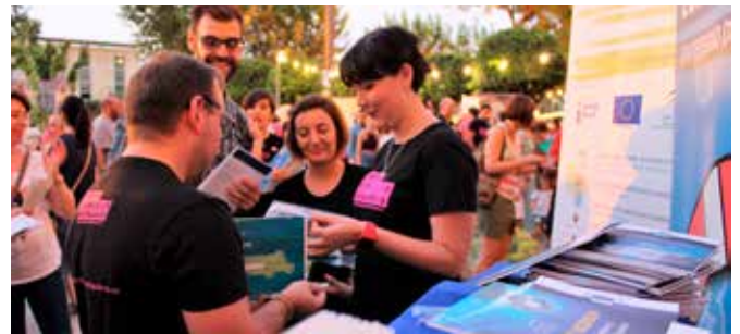
La Noche Europea de los Investigadores

Como en años anteriores, se nos solicitó desde el Rectorado de la Universidad de Córdoba nuestra participación en la organización de "La Noche de los Investigadores", que este año se celebró en los Jardines del Rectorado, el 28 de septiembre. Con esta actividad perseguimos difundir las actuaciones por parte de la UE en relación con la ciencia y la investigación. Contamos con un numeroso grupo de participantes, entre profesores, estudiantes y público en general.