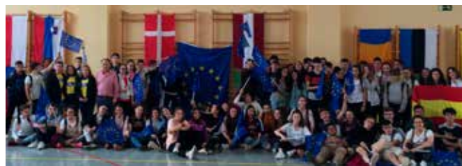
Día Europeo de las Lenguas en EEPP SAFA (Andújar)

Al final realizamos un Scrabble gigante con palabras en diferentes lenguas y la audición del Himno de Europa ante las 28 banderas de la UE. Entrevista para Cadena Ser.