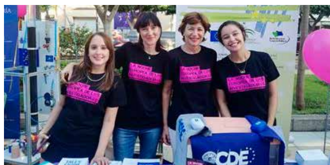
Noche Europea de los Investigadores

El CDE participó en la 13ª edición de la Noche Europea de I@s Investigador@s con un stand informativo sobre sus actividades y servicios. Se presentaron actividades relacionadas con el papel de la mujer en la ciencia y la investigación como un concurso de cartas informativas “Conoce a las mujeres europeas en la investigación”. También se realizó un concurso de dibujo, “El mejor invento del mundo mundial”, con la intención de acercar la ciencia al público infantil. La actividad tuvo aproximadamente un total de 3000 participantes.