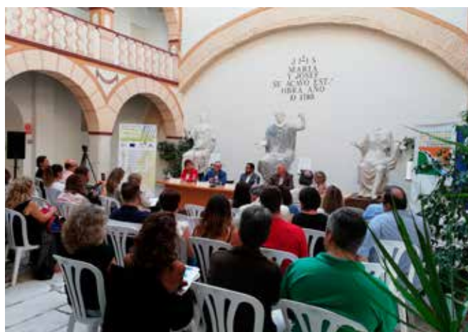
Foro de Debate Ciudadano

Tras el evento los miembros de la Red de Información Europea de Andalucía celebramos un encuentro de intercambio de buenas prácticas de información y comunicación.