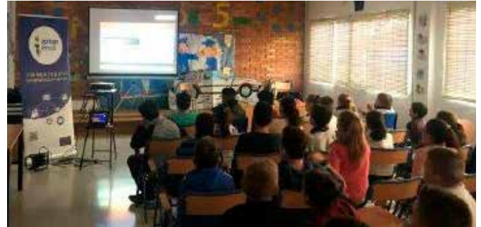
Alumnos de Primaria durante las sesiones

El propósito de estas charlas es mejorar el conocimiento de los alumnos sobre la Unión Europea, divulgar su historia, sus símbolos, principales hitos y el funcionamiento, a la vez que se resalta la importancia que tiene en nuestros día a día las decisiones que se adoptan en el seno de la UE.