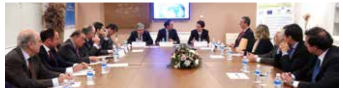
Ponentes durante la inauguración del Seminario

El objetivo era informar al empresariado andaluz de uno de los países con mayor potencial para los negocios del mundo, que cuenta con una población de más de doscientos millones de habitantes y dispone de recursos propios muy importantes, que lo sitúan como la novena potencia económica del mundo a través de la opinión de expertos en la materia.