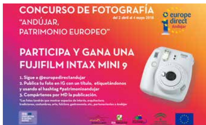
Cartel del Concurso de Fotografía en Instagram