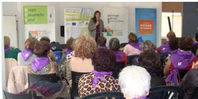
Diálogo con Asociaciones de Mujeres

Inspirado por los diálogos ciudadanos impulsados por la Comisión Europea, el debate sobre los temas prioritarios en el marco del futuro de Europa y de las elecciones al Parlamento Europeo en 2019 viajó por pueblos y aldeas de Córdoba. En concreto se llevaron a cabo 6 diálogos con personas mayores y con grupos de mujeres en Valenzuela, Llano del Espinar, Castro del Río y Baena. Se grabaron microvídeos de los debates para difundir posteriormente los resultados.