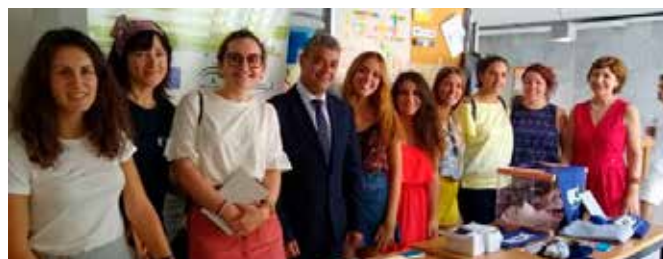
Stand en el Día Europeo de las Lenguas

Para celebrar el Día Europeo de las Lenguas y la riqueza lingüística europea, el Centro de Documentación Europea de Almería preparó un stand informativo desde donde informó a los asistentes de los servicios del CDE, entre ellos, del fondo digital y boletines. Se repartió material divulgativo y se realizó un concurso para probar los conocimientos de los participantes en otras lenguas de la Unión Europea. La actividad tuvo un total de 120 participantes.