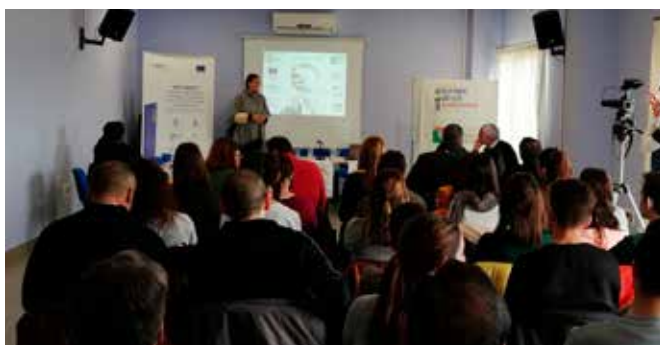
Jornada Patrimonio y Voluntariado

En la sesión estuvieron representadas distintas entidades locales públicas y privadas relacionadas con la gestión del Patrimonio tanto a nivel local como regional y europeo (Ayuntamientos, Junta de Andalucía, Centros Educativos, Universidad de Granada, Programa Europeo URBACT a través del proyecto INT-HERIT, asociaciones de voluntariado a nivel regional...)