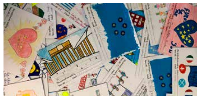
Postales ilustradas por los alumnos

En total participaron 220 alumnos y alumnas de primaria.