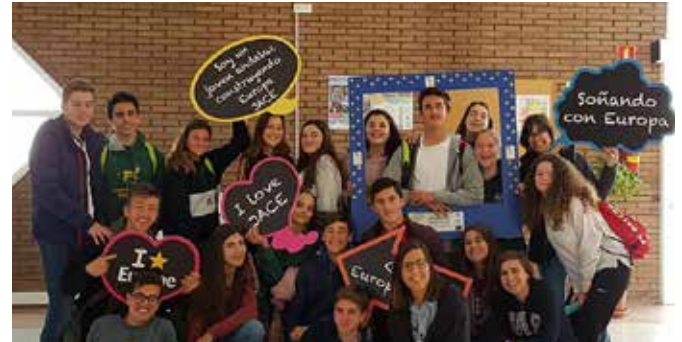
Participantes en JACE del Colegio Alberto Durero

El ED Sevilla participó en la XII edición del Premio Jóvenes Andaluces Construyendo Europa con el Colegio Alberto Durero, de Sevilla, que presentó un trabajo sobre 'Crecimiento y empleo en la UE'.