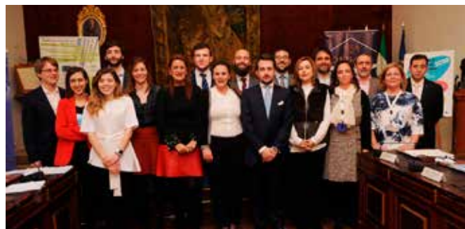
V Torneo Nacional de Debates Universidad de Córdoba