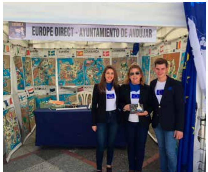
I Feria de la Ciencia celebrada en Andújar

Repartimos un gran número de mapas y folletos de la UE, así como caramelos, todo ello proporcionado por la Representación de la Comisión Europea. Más de 400 personas pasaron por nuestro stand para hacer actividades.