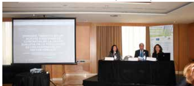
Jornada “Impacto de las nuevas directivas”