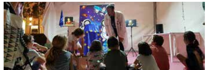
Cuentacuentos en la Noche de los Investigadores

El ED tuvo representación en el córner europeo, que se dotó de un gran número de publicaciones relacionados con los programas de I+D de la UE y además se desarrolló un cuentacuentos "Viaje europeo al espacio" que versó sobre la Unión Europea basándose sobre todo en sus investigadores y científicos, y al hilo de las estrellas que están representadas en la bandera hablar también de los astrónomos europeos.