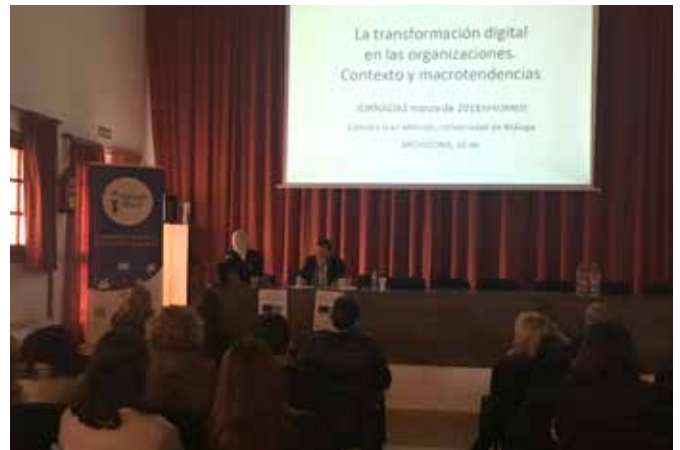
Participantes de la VI Jornada Aprod

Con la realización de esta Jornada se ha conseguido aumentar el nivel de conocimiento en proyectos europeos relacionados con el sector agroalimentario.