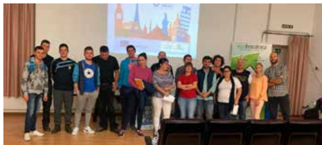
Charla en el EEPP SAFA

Se informa de las posibilidades para jóvenes, de becas, cursos, voluntariado, cuerpo europeo de solidaridad, cómo constituir una empresa... y se les recalca la importancia de aprender una segunda lengua, útil, casi imprescindible en el mundo actual.