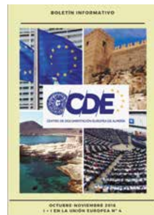
Boletín Innovación e Investigación nº4

Se ha fomentado un trabajo en red en colaboración con otros Centros de Documentación y Europe Direct de la Red de Información de Andalucía, así como nacionales e internacionales.