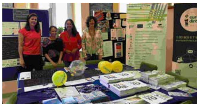
Escuela Oficial de Idiomas de San Roque

Ubicación de stand con material promocional con motivo de este día en la Escuela Oficial de Idiomas de San Roque, y actividad didáctica con los alumnos con el objetivo de que los estudiantes y otros ciudadanos que visitaban el stand colocaran palabras originales para ellos en otros idiomas de la UE en un panel gigante. Realizamos un Taller sobre: "Rarezas lingüísticas", palabras que no tienen traducción, sólo tienen significado en su propia lengua.