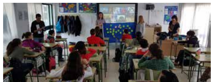
Viernes de Europa