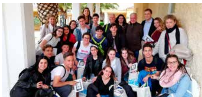
Alumnos/as y profesores/as del IES Don Diego de Bernuy

El Europe Direct Andalucía Rural llevó a cabo previamente tres talleres informativos y de apoyo con los alumnos/as y profesores participantes.