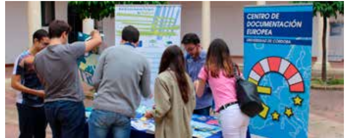
Asistentes en el Día de Europa

Con motivo de este día se instaló un stand en la Facultad de Derecho y Ciencias Económicas y Empresariales al que acudieron alumnas y alumnos, muchos de los cuales eran ERASMUS, así como el profesorado, para festejar el Día de Europa, difundir sus valores y dotar a los interesados de material formativo en materia europea.