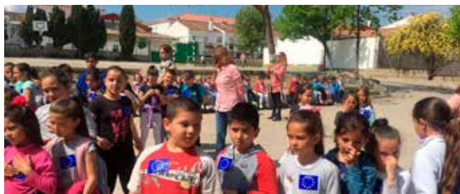
Alumnos CEIP Francisco Ayala de Iznalloz

Así mismo, los colegios CEIP Francisco Ayala de Iznalloz y CEIP Luis Rosales de Granada se unieron en la celebración con la lectura de un manifiesto, reproducción del himno de la UE y participación del alumnado, contribuyendo el CDE con material y documentación sobre la UE.