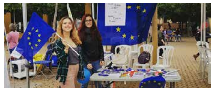
III Muestra Anual de Comunicación en el ámbito educativo

En la Muestra anual de comunicación en el ámbito educativo se contó con un stand en el que los alumnos pudieron trabajar distintos aspectos relacionados con la UE. Casi 2000 alumnos acudieron a esta cita.