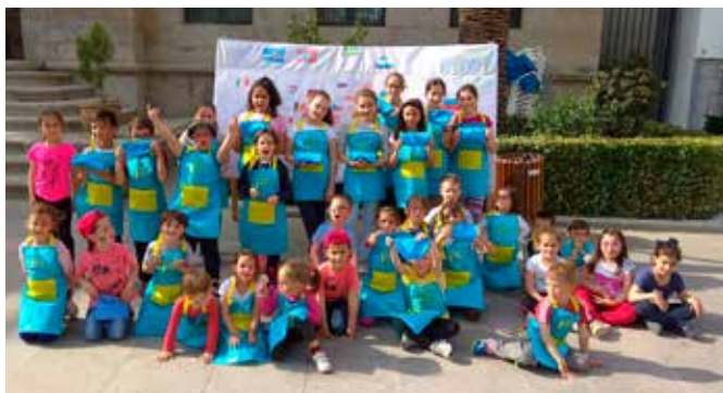
Celebraciones en el municipio de Belalcázar

Dos Torres, El Carpio, El Guijo, El Viso, Espejo, Fernán Núñez, Los Silillos, Villalón, La Ventanilla, Cañada Rabadán, El Villar, Fuente-Tójar, Fuente La Lancha, Iznájar, La Rambla, Los Blázquez, Lucena, Montemayor, Montilla, Montoro, Monturque, Palma del Río, Pedro Abad, Pedroche, Peñarroya-Pueblonuevo, Posadas, Priego, Puente Genil, San Sebastián de los Reyes, Santa Eufemia, Valenzuela, Valsequillo, Villa del Río, Villafranca, Villanueva del Duque, Villanueva del Rey, Zuheros.