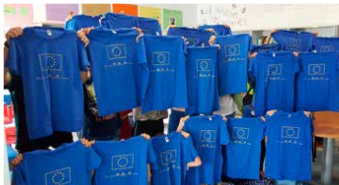
Celebraciones en el municipio de Valenzuela