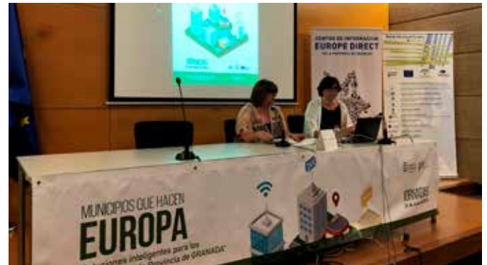
Inauguración de las Jornadas

El 11 de julio y 13 y 20 de noviembre, se celebraron estas sesiones dirigidas a informar a jóvenes de entre 18 y 30 sobre qué es y cómo participar en el Cuerpo Europeo de Solidaridad.