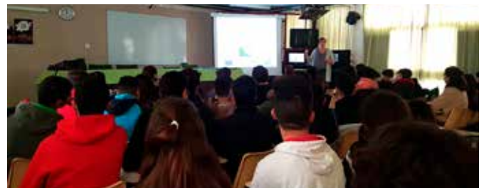
Taller en inglés sobre Derechos y Movilidad

Del 16 al 27 de julio impartimos en Baena estos 8 talleres de 3 horas y media de duración conectados entre sí en el marco de los temas prioritarios de la UE para 2018 y en el contexto del debate sobre el futuro de Europa. En los talleres se empleó una metodología participativa y de aprendizaje en el ámbito no formal y participaron una media de 15 jóvenes en cada uno de los talleres.