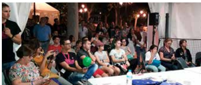
Stand en la Noche Europea de los Investigadores

El CDE se sumó a la Noche Europea de los investigadores. Estuvo presente el 28 de septiembre en uno de los stands del Paseo del Salón de Granada con dos actividades dirigidas al público en general. Por un lado conocer qué es y para qué sirve un acelerador de partículas, y por otro, informar sobre las oportunidades de empleo, becas y premios que la UE convoca en el ámbito de la ciencia y la investigación.