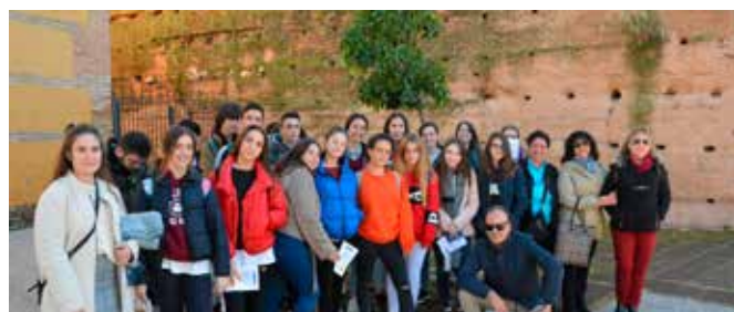
Taller infantil sobre la UE