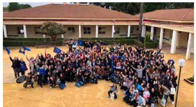
Grupo de participantes en JACE

Por parte de la provincia de Málaga concursó un grupo de Primer Ciclo Formativo de Grado Medio del IES Vega de Mar, ubicado en San Pedro de Alcántara, con el tema “Derechos Fundamentales en la Unión Europea”.