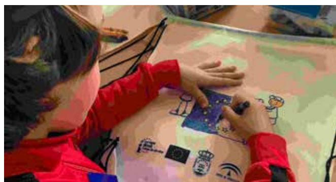
Día Europeo de las Lenguas

Los objetivos eran alertar al público sobre la importancia del aprendizaje de idiomas y diversificación de la gama de lenguas, a fin de incrementar el plurilingüismo y la comprensión intelectual. Promover la rica diversidad lingüística y cultural de Europa y fomentar el aprendizaje permanente de idiomas dentro y fuera de las escuelas.