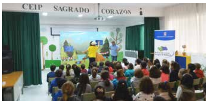
Teatro en CEIP SAGRADO CORAZÓN

A lo largo de 2018 se han atendido 19 peticiones, de las cuales 7 han sido financiadas por la subvención nominativa de la Red y las 12 restantes con fondos propios de la Diputación.