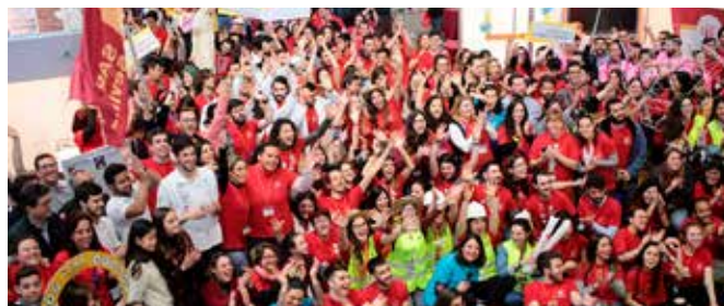
Salón del Estudiante

En estas actividades se colocaron stands con material de divulgación y merchandising; para ello se solicitó a Eubookshop y a la Representación de la CE en España material promocional y folletos divulgativos relacionados con la política de juventud, formación y empleo en la UE y la política de investigación y desarrollo en la UE.