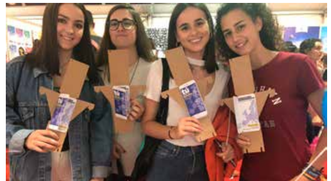
Universitarias con el folleto en las Jornadas de Recepción de Estudiantes

Se editaron un total de 1000 ejemplares de este folleto dirigido a jóvenes de la provincia, con el objetivo de explicar a estos jóvenes nuevos votantes por qué es importante que participen en los comicios europeos del 26 de mayo.