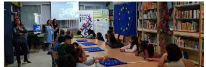
Día de Europa

El CEIP San José Obrero celebra tradicionalmente el Día de Europa y en él el ED Sevilla organizó distintos juegos y talleres sobre los países de la UE, sus valores, sus banderas, las lenguas, etc. Más de 500 alumnos compartieron una jornada en la que se trabajó sobre la historia de la UE.